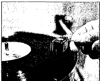
Ritual: Das Auflegen der Nadel braucht Zeit.