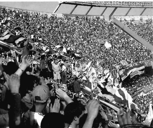
Fußball-Karneval in Brasilien: Je südlicher die Standorte der Fußballarenen, desto turbulenter und lauter das Fanverhalten.